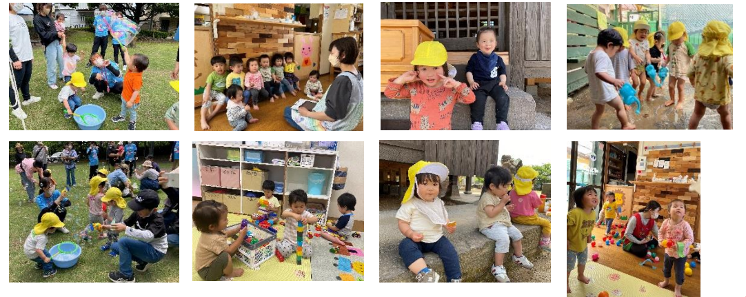
おともだちといっしょに！ どこにいるかな？