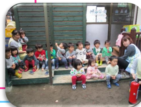
避難訓練をしました。 1人ずつ消火器で火を消しました。 かっこよかったです。

『かいじゅうが、でたぞー！』『まてー！』元気な声が響いています。 最近ブームのヒーローごっこ(鬼ごっこ)。 声をかけ合ったり、相手の動きを目で追ったりなど 遊びの中で、お友達の存在を感じているようです。 さて、クリスマスシーズン到来です☆ ゆめっこの環境もクリスマスバージョンに様変わりしました。 子ども達も、味のあるかわいいサンタさん作りに挑戦し、飾りつけをしました。 クリスマス前には、持って帰りますので、楽しみにして下さいね。