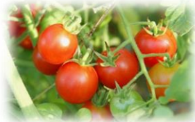
ゆめっこで育てているミニトマトも赤くなりました。