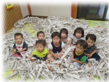
やぶり紙にうもれて…。