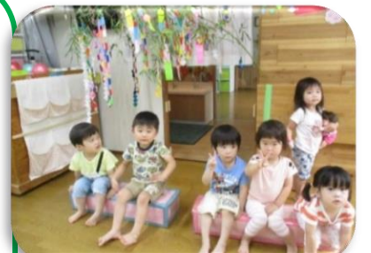
セタ…お願いごと叶ったかな？

暑い中、おでこに汗をにじませ、元気一杯に遊ぶ子ども達。 朝のお集まりでは、保育士の「〇〇ちゃん！」の声かけに 大きな声で「ハイっ！」とお返事する子 ちょっぴり恥ずかしそうに小さな声でお返事する子 それぞれ、個性があり愛らしいです。 又、手あそび歌♪三匹のこぶた♪が大好きです。 最後の「ふ〜とふいたら」…「あれ？」の場面で、子ども達が首をかしげるしぐさは、とってもかわいいですよ！