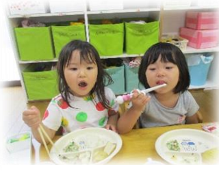
水あそび後の 給食おいしいね！