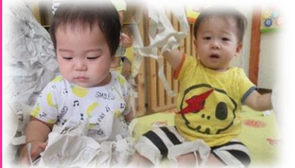
二人いっしょに 紙あそび♡

生まれて初めて水あそび、少しでも水が体に触れると「え〜ん△」冷たい水に驚き、お顔も体もびっくり！！ 少しずつお水に慣れ、楽しんでくれるといいな♡ ハイハイも上手になり、気がつけば あっちへ こっちへ…… いったきも 目が離せません。 お兄ちゃん、お姉ちゃん達も二人の事が大好きでやさしく名前を呼んで、頭をなでてくれます。 二人共、とってもいい表情でやんちゃな姿が垣間見れ愛らしいです。