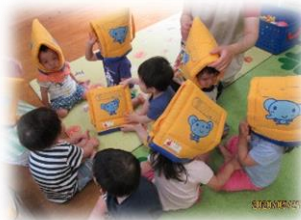
地震の訓練！ 防災頭巾をかぶって…。