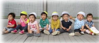
もうすぐバスが とうちゃくしまーす。 （県病バス停にて）