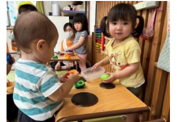
おままごと 今日は、何のおごちそう？