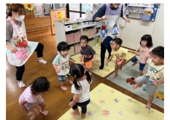
♪幸せならあしならそう♪ トントン みんな上手だね。