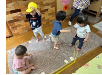
プチプチをアンヨでつぶすよ 「プチッ」となる音が たのしいね。