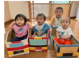
ダンボールののりものに のってプッパー。