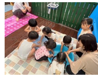
ハンカチをおせんたく。 ママのように上手に 洗えるかな？