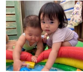
ピチャピチャ・・・ お水つめたいねー。

0才児～2才児の17人の子ども達。 年齢、成長、発達 それぞれ違いますが どの子も探求心いっぱい！ 新しいもの、 目に入るもの興味津々、のぞいたり、 さわったり、押したり、ひっくりかえしたり、 落としたりなど 一刻も目が離せません。 そんな子ども達の思いや好奇心に答えて あげるために、私たち保育士は、日々の遊び を工夫し、ワクワク、ドキドキ感を 大事にしたいと考えています。