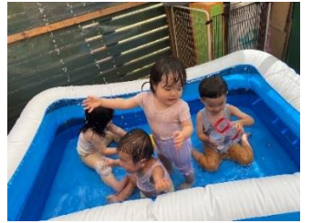
大きいプールでも 平気だよ！