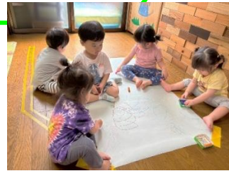
大きな紙に クレパスでぐるぐる・・・ お絵描きたのしいね。