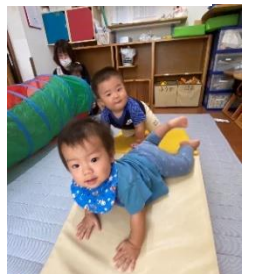
坂道もへっちゃら！ ハイハイで ヨイショヨイショ！