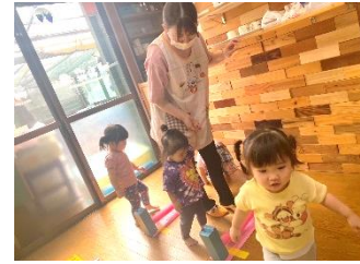
「手作りハードル ほくもできるよ」 先生といっしょにヨイコラショ！