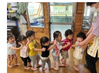
♪かもつれっしゅしゅしゅしゅっ♪ おともだちとつながってたのしいねー。