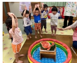
スイカ割に挑戦！ みごとに割れたスイカに みんなでバンザイ！